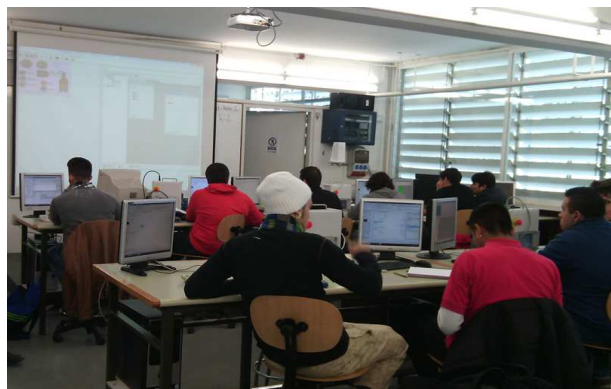
Aula Taller d'automatismes

Té una durada de 2.000 hores, repartides en dos cursos acadèmics: 1.683 hores lectives en el centre docent i un mínim de 317 hores de Formació en Centres de Treball (FCT), pràctiques que es realitzen en alguna de les empreses col·laboradores del centre.