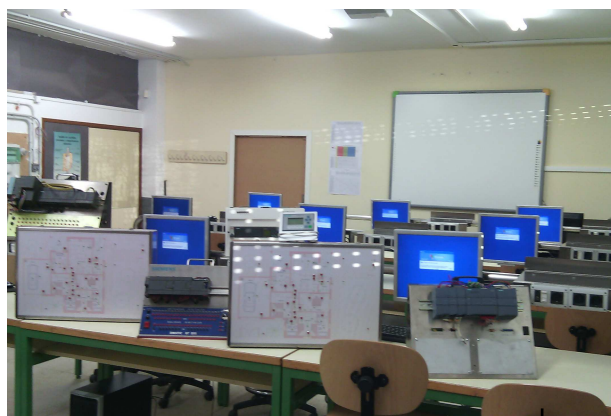
Aula amb entrenadors de domòtica